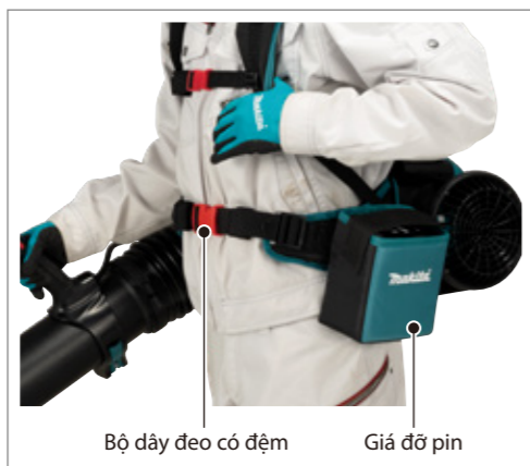
Bộ dây đeo có đệm