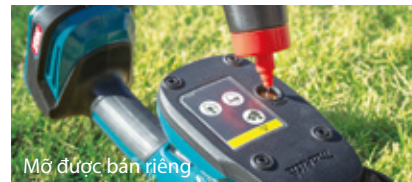
Mỡ được bán riêng