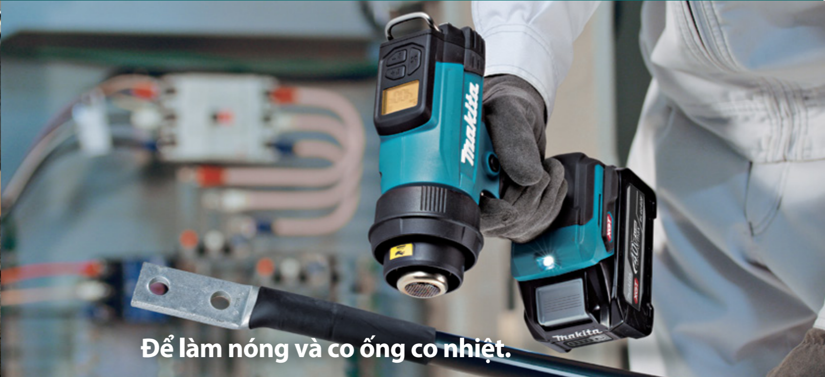
Để làm nóng và co ống co nhiệt.