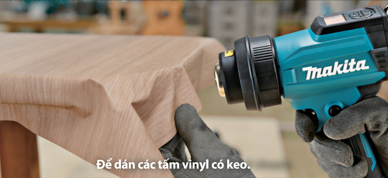
Để dán các tấm vinyl có keo.