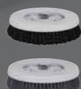
Vệ sinh trong phòng tắm