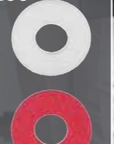
Dùng cho việc đánh bóng (sử dụng với sáp nhựa)