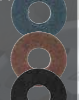
Dùng cho việc làm sạch (sử dụng với sáp nhựa)

Xanh Mã số: 1914S7-5 Nâu Mã số: 1914S8-3 Đen Mã số: 1914S9-1