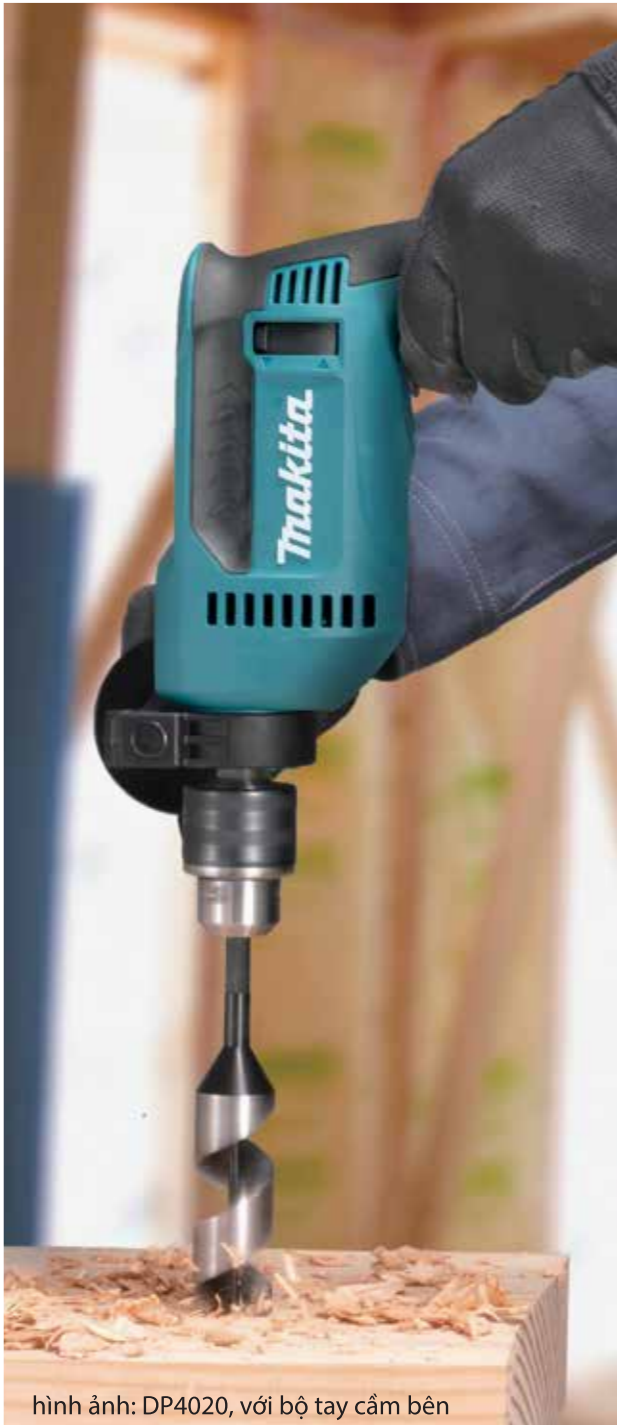
hình ảnh: DP4020, với bộ tay cầm bên