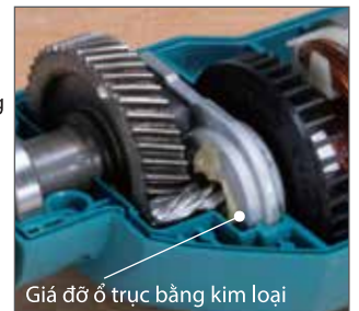
Giá đỡ ổ trục bằng kim loại

Độ bền của phần ổ trục đã được cải thiện bằng cách sử dụng giá đỡ ổ trục bằng kim loại.