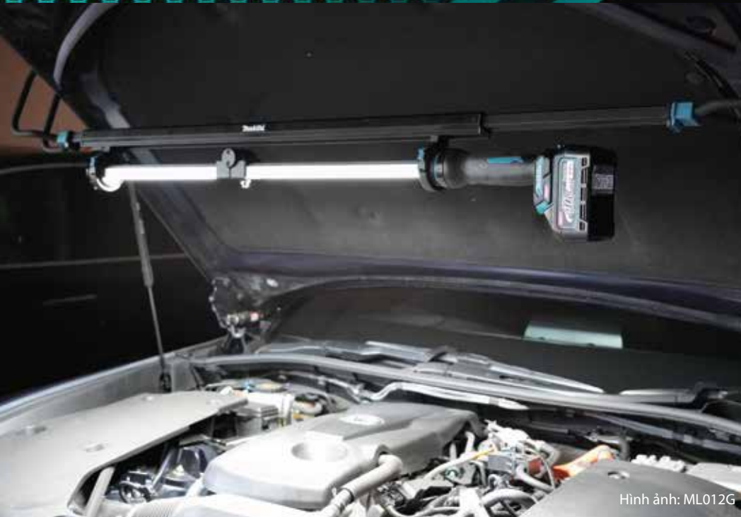
Hình ảnh: ML012G