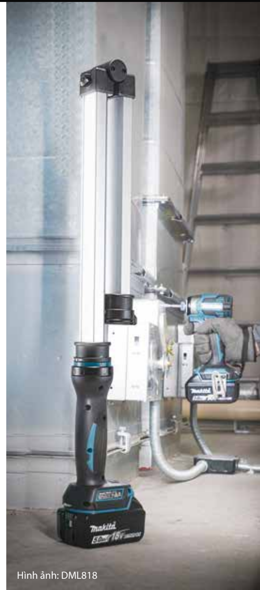
Hình ảnh: DML818

Thời gian hoạt động liên tục trên 1 lần sạc đầy pin