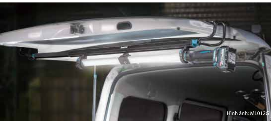
Hình ảnh: ML012G