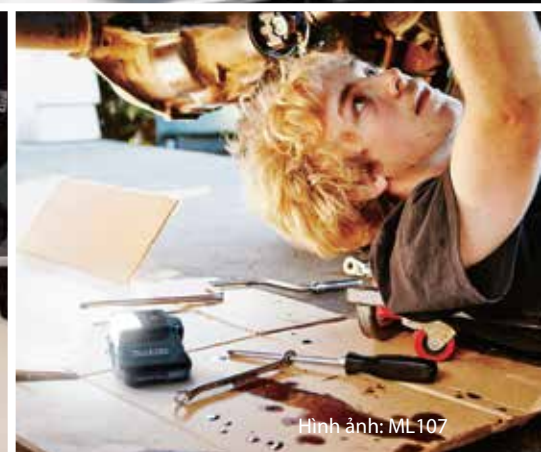
Hình ảnh: ML107