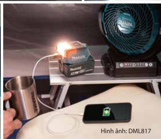
Hình ảnh: DML817