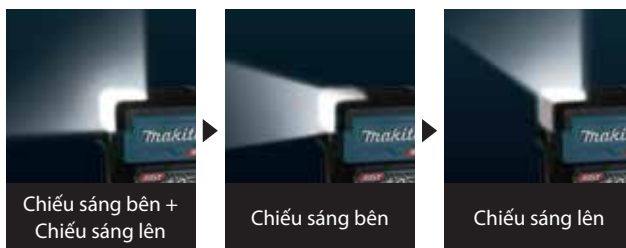
Chiếu sáng bên + Chiếu sáng lên

Được trang bị 2 đèn LED, một cho chiếu sáng bên và một cho chiếu sáng lên, để chiếu sáng góc rộng.