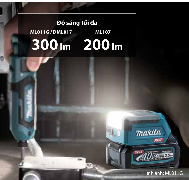
Hình ảnh: ML011G

Độ sáng tối đa ML011G / DML817 | ML107 300 lm | 200 lm