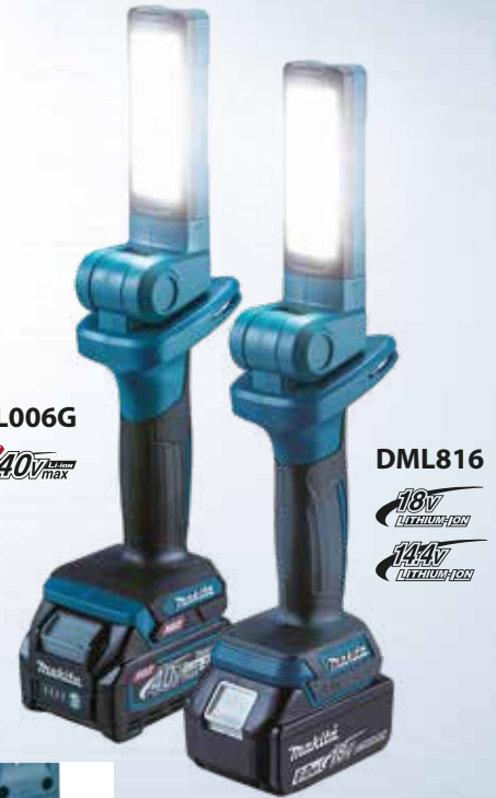
ML006G 40V LITHIUM-ION max

Có thể được sử dụng như một đèn để bàn nhỏ gọn với đầu nhẹ xoay và gấp hoàn toàn.