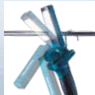
Móc treo lớn