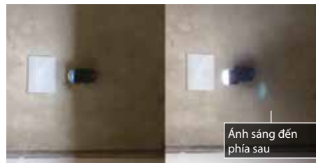
không có chụp chống chói có chụp chống chói