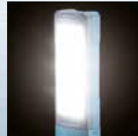
Thấu kính khuếch tán ánh sáng