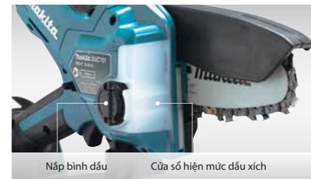
Nắp bình dầu