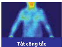
Tắt công tắc