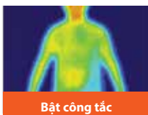
Bật công tắc