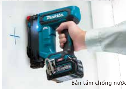
Bắn tấm chống nước

Có thể thao tác mạnh mẽ với nhiều công việc khác nhau