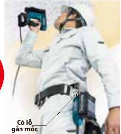
Có lỗ gắn móc