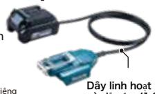
Dây linh hoạt và dễ cầm (1,6m)