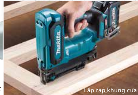
Lắp ráp khung cửa