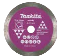
Lưỡi cắt kim cương/ mép liên tục Vật liệu cắt: Gạch ngói