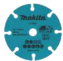
Lưỡi cắt kim cương đa năng Vật liệu cắt: Thạch cao, tấm nhựa, tấm ốp bằng gốm