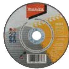
Đá cắt/ mỏng Vật liệu cắt: Inox, thép