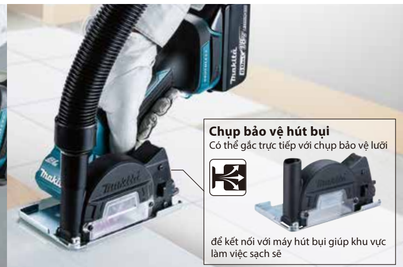
Chụp bảo vệ hút bụi Có thể gắn trực tiếp với chụp bảo vệ lưới để kết nối với máy hút bụi giúp khu vực làm việc sạch sẽ