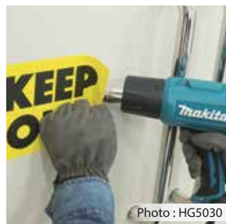
Photo : HG5030