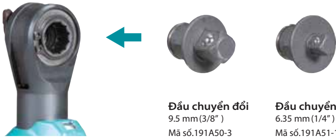
Đầu chuyển đổi 9.5 mm (3/8") Mã số.191A50-3