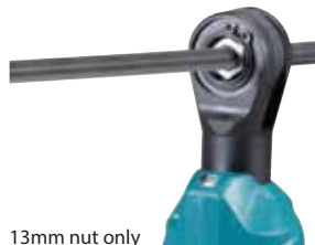
13mm nut only