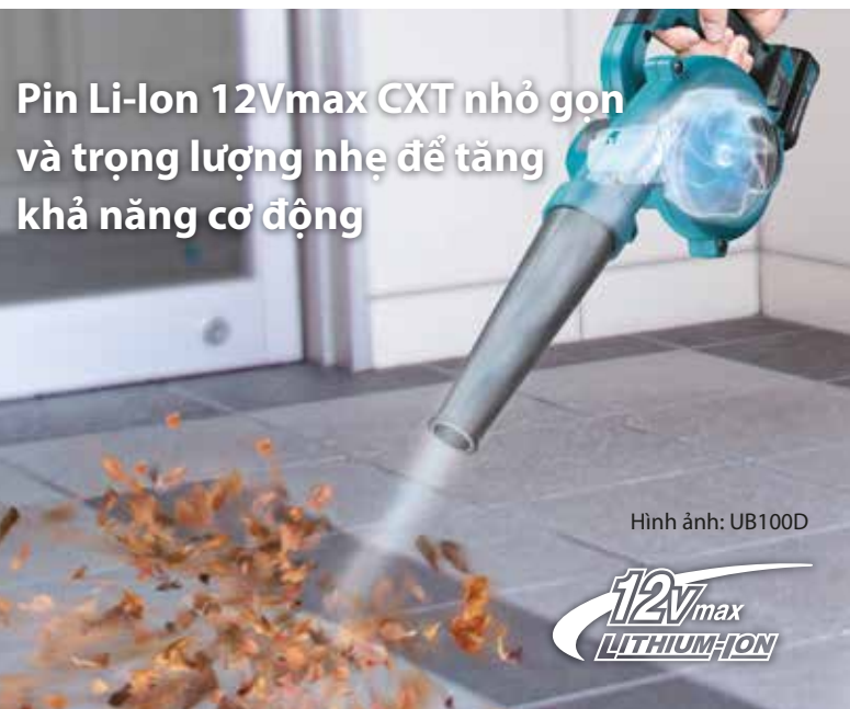
Hình ảnh: UB100D

Pin Li-Ion 12Vmax CXT nhỏ gọn và trọng lượng nhẹ để tăng khả năng cơ động