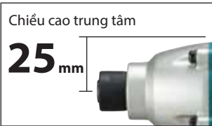
Chiều cao trung tâm