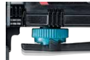
Điều chỉnh độ sâu đinh bắn