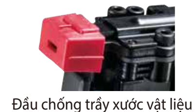
Đầu chống trầy xước vật liệu