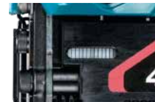
Cửa sổ kiểm tra lượng đinh còn lại