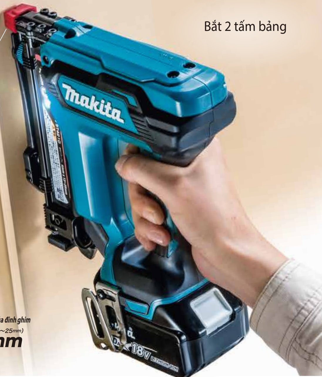
Bắt 2 tấm bảng

Có thể bắn dễ dàng dù điểm tựa nhỏ (hẹp)