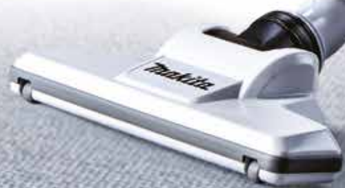
CL003G [サイクロン一体式]