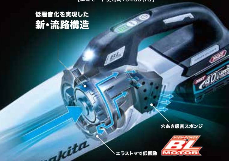
穴あき吸音スポンジ