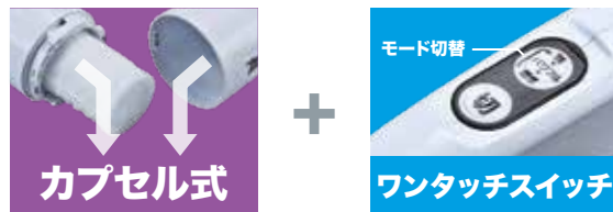
簡単ゴミ捨て / モード切替え