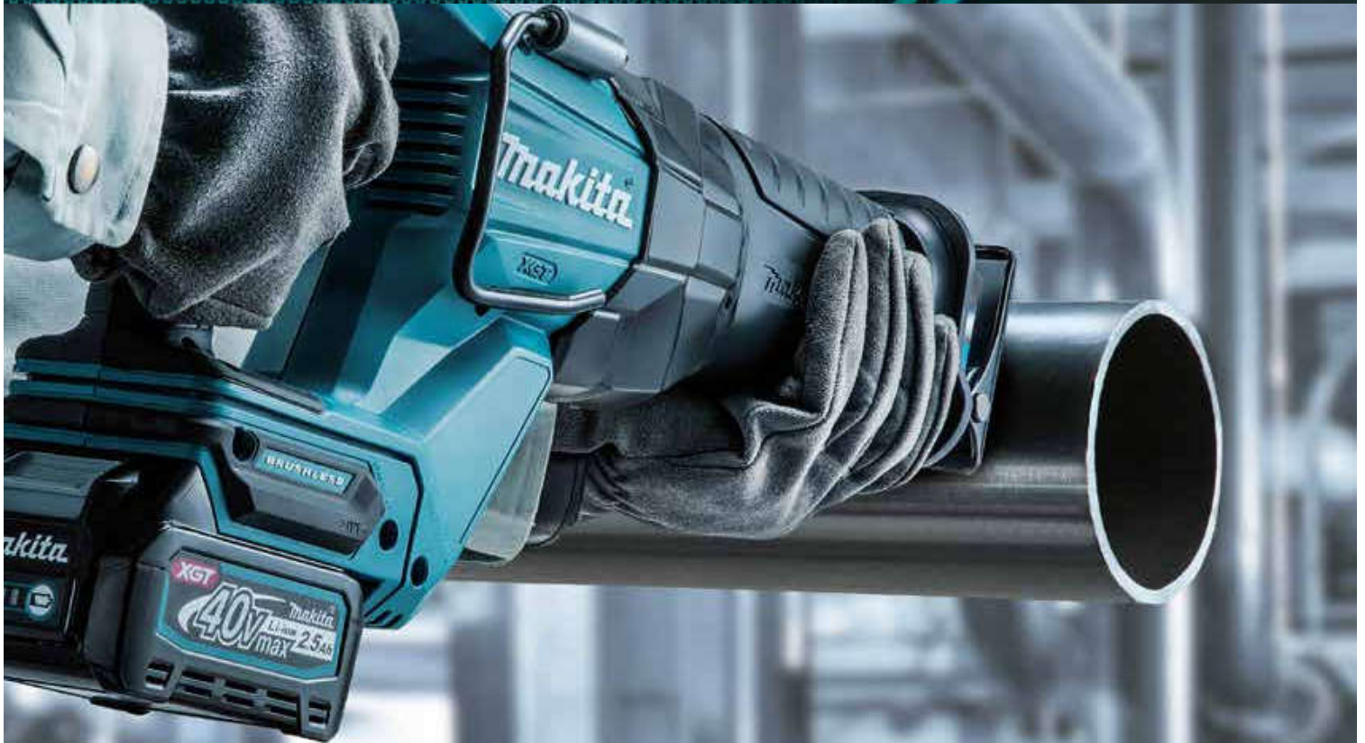
Máy Cưa Kiếm JR001G