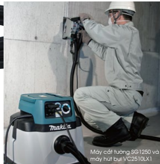
Máy cắt tường SG1250 và máy hút bụi VC2510LX1