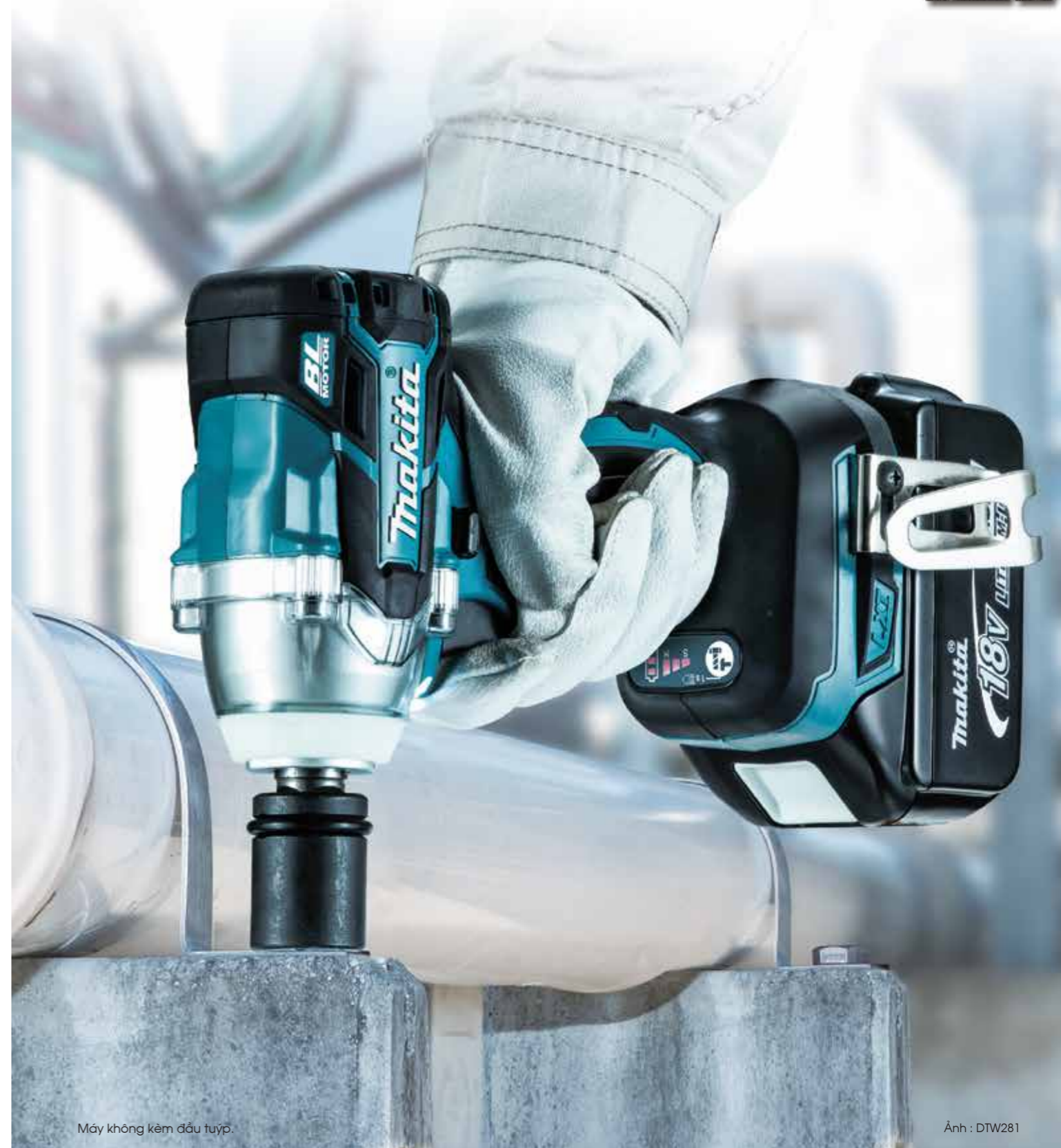
Máy không kèm đầu tuýp.